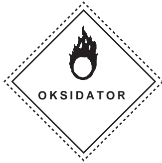
Signage Oxidation-Chainable (Bahaya Mengoksidasi)