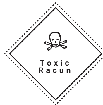
Signage TONIC (Racun Berbahaya)