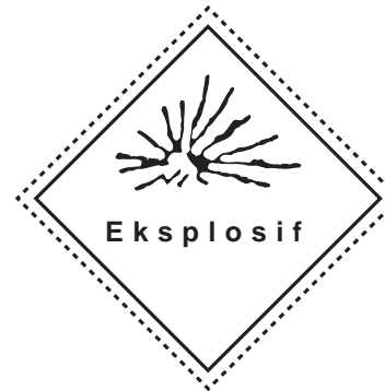
Signage - Eksplosif ( Mudah Meledak )