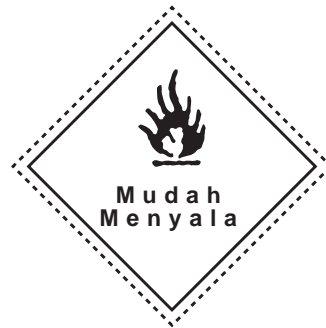
Signage Flammable (Mudah Menyala)