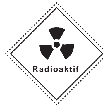
Signage RADIOATION - Hazard (Bahaya Radioaktif)