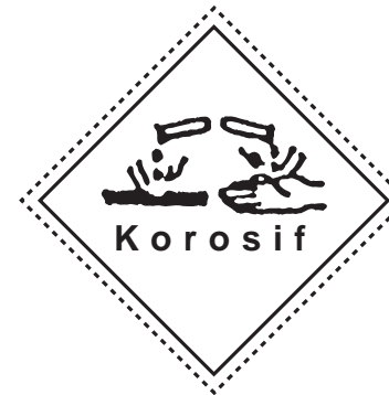
Signage - Korosif ( Mudah Membuat Karat )